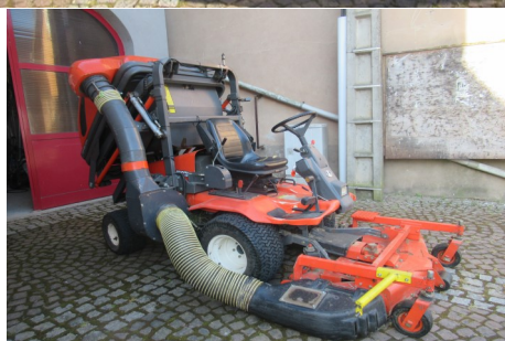
ancienne tondeuse reprise